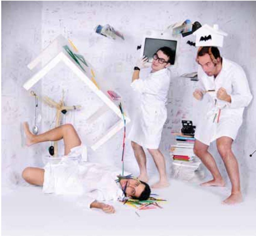
(03) Mesa "Vig" - Diseño: Estudio Estres / (04) Equipo Estudio Estres / (05) Lámpara "Lham" - Diseño: Joan Rojeski / (06) Los diseñadores Iger by Aker / (07) Buzón "PrimerB" - Diseño: Joan Rojeski / (08) Equipo Joan Rojeski / (09) Stand de Iger by Aker durante NUDE 2010.

Nuestro objetivo en el Nude no ha sido vender el producto sino hacer contactos, dar a conocer nuestro trabajo y ser parte de este "mundillo del diseño". ¿Qué otros medios de comunicación se han hecho eco de vuestra participación en el Nude? Medios digitales, principalmente blogs dedicados al diseño como Yatzer, Thedesign vlog... Aunque la repercusión mediática se deja ver más a largo plazo, aún seguimos publicando cosas referentes al Nude 2009. ¿Os sentís una promesa del diseño? Creemos que el diseño no es cuestión de ser o no una promesa. Ser un buen diseñador es una cuestión que viene marcada por el trabajo y esfuerzo diario.