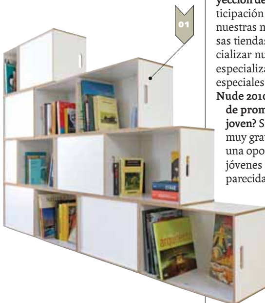
(01) Diseñadores Salvador & Zanni con "BrickBox" / (02) "BrickBox" Librería modular - Diseño: Salvador & Zanni.

25 estudios y diseñadores han participado en la octava edición, nude 2010. ¿Cuál ha sido el resultado? ¿Cumple el nude su objetivo de promover el trabajo de los diseñadores jóvenes entre los empresarios del mundo del hábitat? 4 estudios participantes en esta reciente edición dan respuestas.